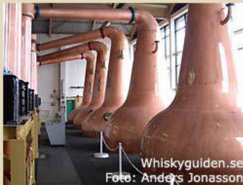
Whiskyguiden.se Foto: Anders Jonasson

Produktionskapaciteten uppgår till 3,8 miljoner liter per år. Caol Ila ingår i bland annat i Bells blended whisky.